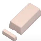
Rilevatore di contatto